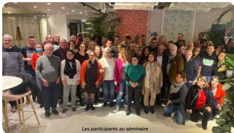
Les participants au séminaire

L'Union nationale des Personnels FO-HABITAT a organisé les 8, 9 et 10 Mars 2022, à Avignon, son séminaire ayant pour thème « gagner les élections professionnelles ».